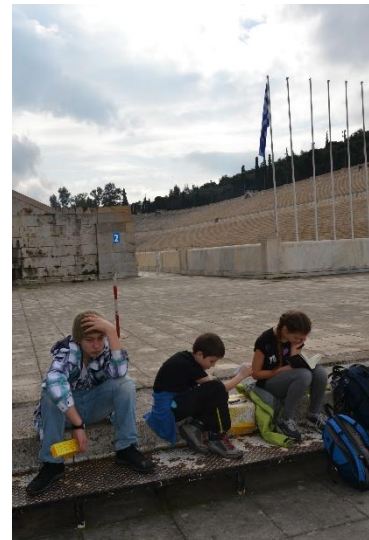
Wo war doch gleich das Panolympische Stadion?